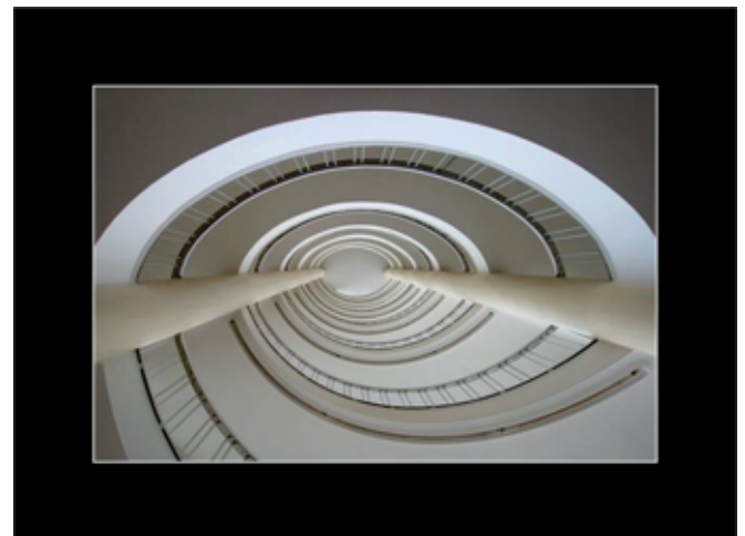
2. Platz Anne Schreiber