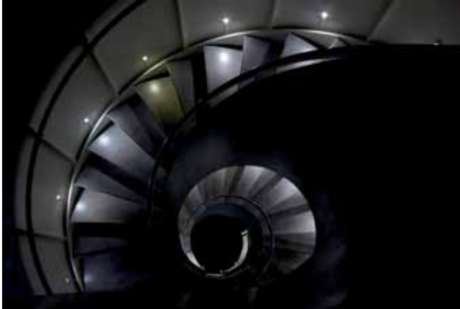
3. Platz Gabi Jachimsky