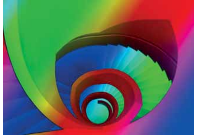
3. Platz Renate Klinkel