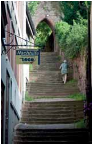
3. Platz Rudolf Dölling