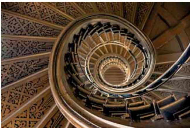
3. Platz Heidi Winkels