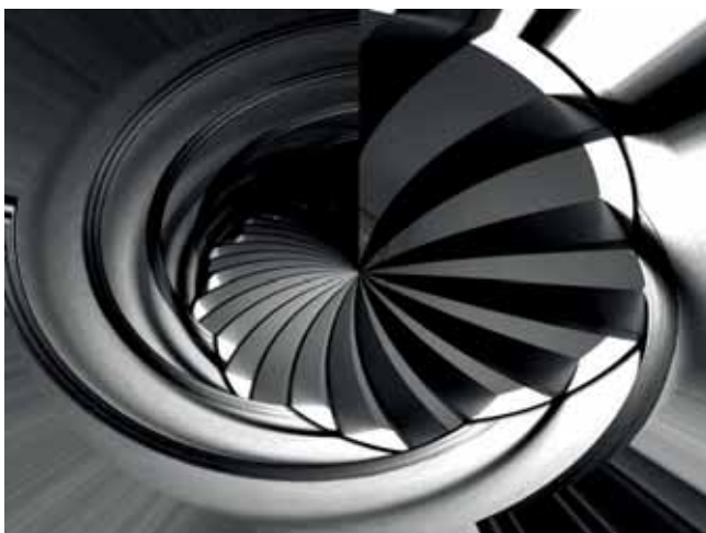
1. Platz Renate Klinkel